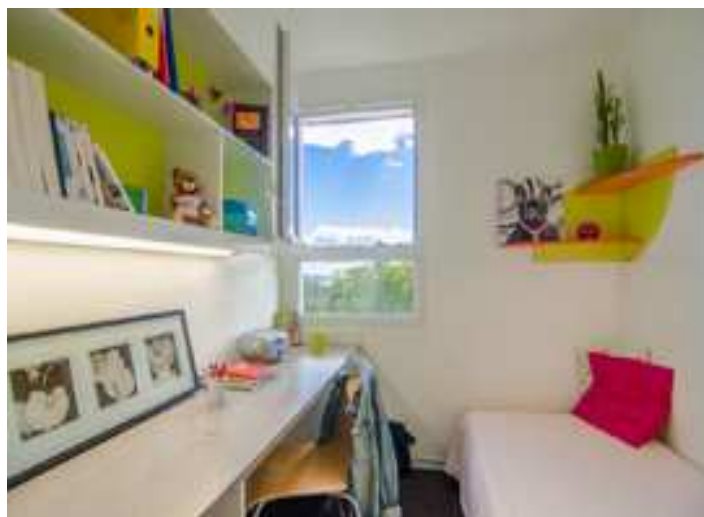
Exemple type d'une chambre en résidence universitaire «Saint Antoine»