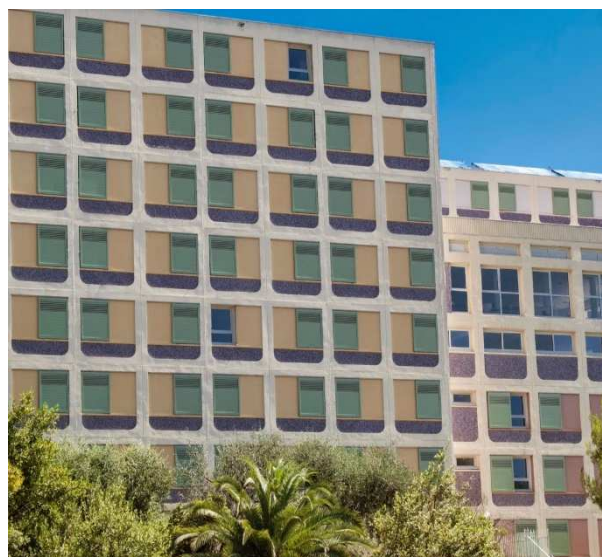
Résidence universitaire «Saint Antoine»