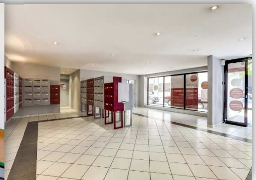
Entrée Résidence Nexity Riquier